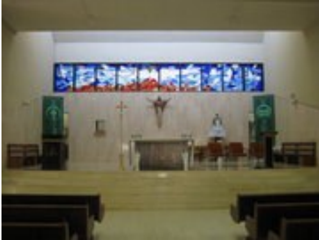
Parroquia Espíritu Santo, Levittown, Puerto Rico

Me he mantenido dentro de la fe católica con variaciones en la intensidad (desde no ir a la iglesia, ir esporádicamente a misa, ir todos los domingos, hasta el presente que es, prácticamente, una necesidad la asistencia a Misa diaria y a otros actos de fe. De niña participé en Hijas de María, Legión de María y Catequesis. También por breve tiempo pertenezco a la Juventud de Acción Católica (JAC).